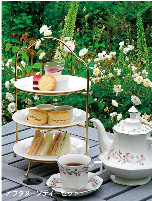
アフタヌーンティーセット