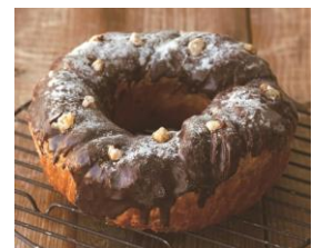
小樽洋菓子舗ルタオ