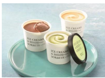
パティスリー キハチ アイス&ソルベ 6 種 12 個入 5,400 円