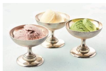
帝国ホテル アイスクリーム (5 種・計 10 個) 5,400 円