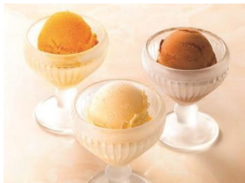
ドゥパイヨル グラス&ソルベギフト (4 種・計 9 個) 5,400 円

「暖かい室内で食べるのが堪らない」と冬でも人気のクールデザートを計 8 種そろえます。