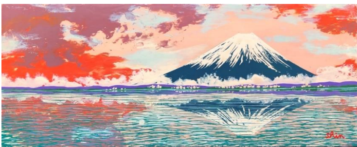
▲赤富士(キャンバスサイズ 20cm×8cm)