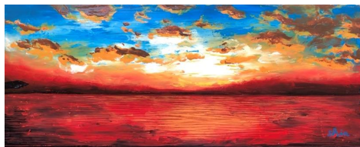
▲夏の思い出(キャンバスサイズ 20cm×8cm)