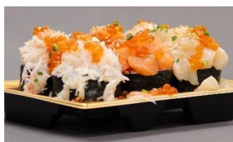
[札幌] オカズヤ「こぼれ海鮮キンパ」 2,700円 京・初

漁業、畜産が盛んな北海道の海鮮・肉をふんだんに使用した見た目も味も楽しめる豪華弁当。2週目には、京王百貨店限定販売の9種を含む計13種が店頭に並びます。