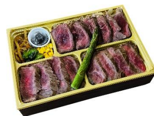
[札幌] グリルサーカス 「道産牛食べ比べ弁当」3,456円 <各日 100点販売予定> 京・限