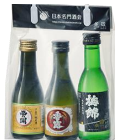
<酒売場> 日本名門酒会「うな酒3撰」 (180ml×3本) 1,276円

※写真左から西の関「手造り純米酒」、香露「特別純米酒」、梅錦「純米吟醸原酒 酒一筋」の3本セットを季節限定販売