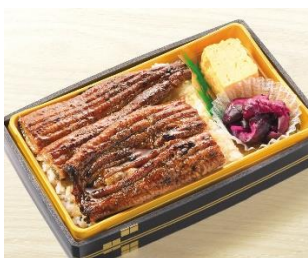
<生鮮・グロサリー売場> 吉川水産「うな重」 (1折) 2,990円