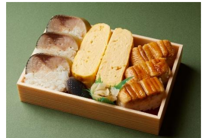
割烹たけし 「鯖寿司穴子寿司だし巻き弁当」 (1折) 1,480円