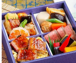
<惣菜・デリカ売場> なだ万厨房「ローストビーフと 四万十うなぎ御飯のお弁当」 (1折) 3,240円