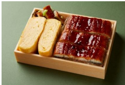
割烹たけし初出店 「鰻だし巻重」 (1折) 2,490円