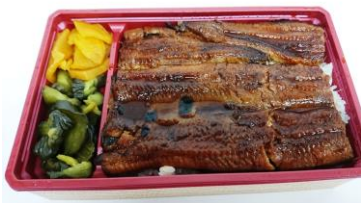
いち屋「鰻重(梅)」 (1折) 5,500円

エキサイティングスポットでは期間限定でウナギに加え、サバ・アナゴ寿司弁当、一度にステーキとウナギが楽しめるスタミナ弁当など期間限定で4店舗の丑の日グルメを集積します。