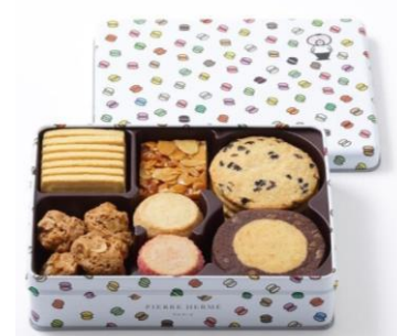
ピエール・エルメ・パリ 「サブレ詰合わせ」4,536円 ※12月8日(金)までの承り。 最終発送日は12月19日(火)。