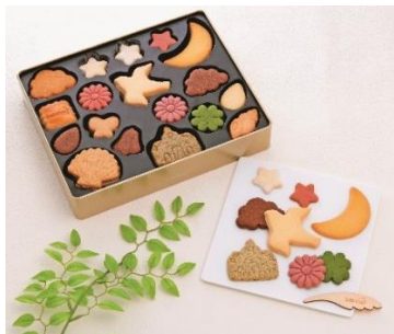
アトリエ サブレヤ NEW 「アトリエアソート」3,240円