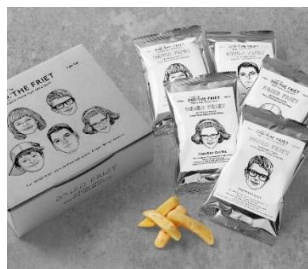
AND THE FRIET NEW 「ギフトボックス ミニ 5個」 1,401円