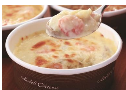
●ホテルオークラ「グラタン&ドリア」5,400円 (シュリンプマカロニグラタン・ポテトグラタン・ビーフドリア各2)