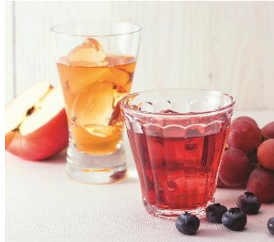
●内堀醸造 「フルーツピネガー8本セット」 (150ml・6種、計8本)3,564円