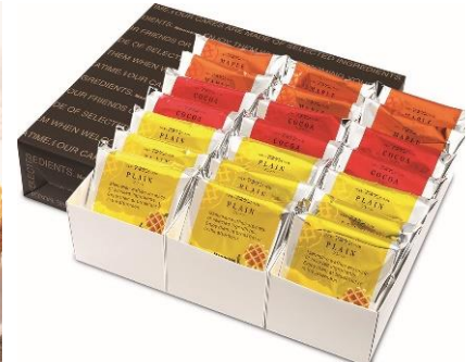
マネケン 「ベルギーワッフル詰合せ」 21個入」4,331円 NEW

※12月14日(木)までの承り。 12月20日(水)以降のお届け、最終お届けは12月24日(日)。