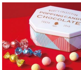
メリーチョコレート 「ポッピングキャンディ チョコレート」1,782円