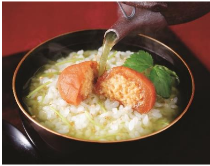
●岩谷 NEW 「紀州 梅真鯛梅」 (5個入) 3,618円 (8個入) 5,184円