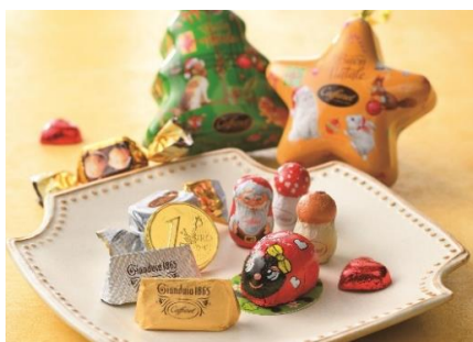
カファレル 「ボンナターレ」5,940円