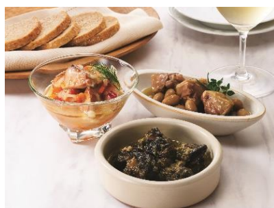
●帝国ホテル「洋惣菜缶詰セット」5,400円 (サーモンのエスカベージュ 85g×3・エスカルゴのブルゴーニュ風 65g×2・鴨のコンフィ 85g×1)