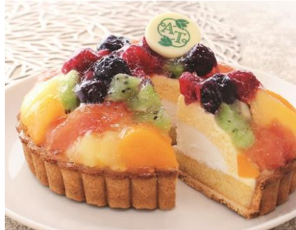
アフタヌーンティー・ティールーム 「フルーツタルト」4,860円 (直径12cm) NEW

※12月17日(日)までの承り。 12月29日(金)・12月30日(土)のお届け。