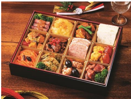
函館 五島軒 「洋風おせち一段重」14,040円 NEW

日常使いに嬉しいお買い得品をはじめ、クリスマスや年末年始の家族の帰省時などにおもてなしの一品としてもおすすめのグルメやこだわり料理を手軽に満喫できる時短グルメなど「ご自宅用限定商品」を約 180 種類そろえます。