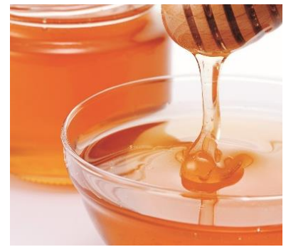
●AFC 「日本のはちみつあかしあ&百花」 (210g・各1個) 4,860円 (360g・各1個) 7,020円