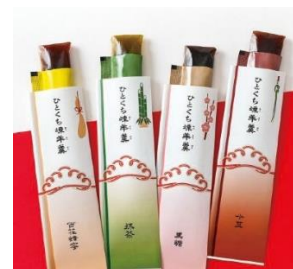
榮太樓總本舗 「ひとくち煉羊羹 7本入」 1,458円