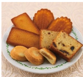
アンジェリーナ NEW 「焼菓子アソート」 2,376円

1,000~2,000円台のギフトを特集する「京王の冬みやげ」は、「帰省の時や友人との集まりに持参する」「複数のブランドを組み合わせたい」といった幅広い利用があり年々伸長しています。手軽なサイズで値ごろ感がありながらも、色々な味が楽しめるプチギフトが充実します。