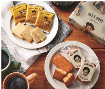
ザ・メープルマニア NEW 「メープルギフト18枚」2,921円

ここ数年好調な洋菓子は今年の中元期でさらに伸長。初登場ブランドや可愛らしいパッケージのギフトにも注目です。