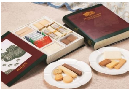
小岩井農場 「農場コレクション」4,752円 ※12月15日(金)までの承り。 最終発送日は12月24日(日)。