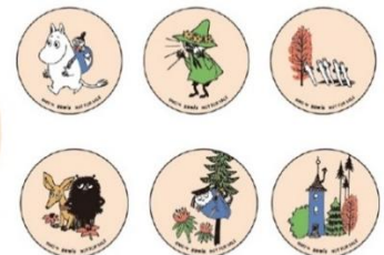
オリジナルステッカー