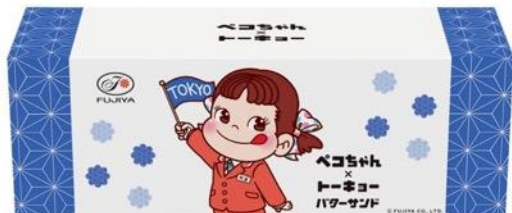
▲6 個入(3BOX) 外箱

ペコちゃんと東京のモチーフがデザインされたBOXに、バターサンドを2個入れました。クリームのフレーバーは全6種で、フレーバーごとにBOXのイラストも異なり、選ぶのが楽しくなっちゃう一品です。本催事限定で新宿デザインのBOXも登場します。