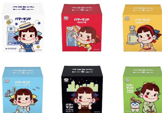
▲全 6 種類の BOX デザイン & フレーバー