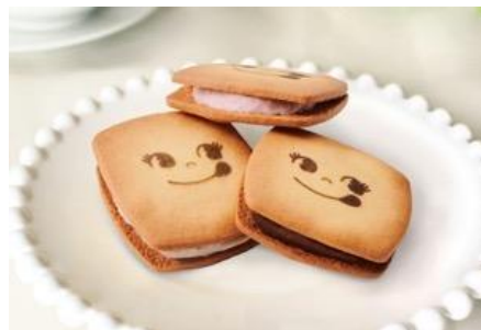
▲バターサンドイメージ

お好きなBOXを3つ選んで詰め合わせることができる6個入もあり、お土産にぴったりです。