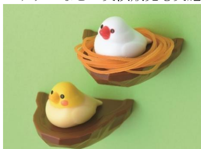
ピッテ biite「鳥の巣 輪ゴムホルダー」各1,485円

小鳥モチーフの雑貨や飼育用品などが集結。日替わりでクリエイターによるイラスト制作や小鳥モチーフのアクセサリなどの実演販売も実施します。