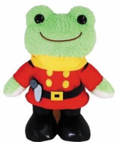
「サイボーグ009×かえるのピクルスぬいぐるみ(立)」3,630円