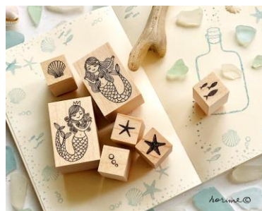
horime tougei「ラバースタンプ」(マーメイド:右・左2ヒレ)各880円 / (貝、ヒトデ、サカナ、泡など)各495円

昨年、文具好きな方や訪日外国人客の方を中心に人気を集めたイベントを今年は7階大催場にて開催。35名以上の人気作家が手掛けるハンコが集結します。