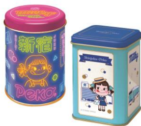
「ミルキー缶(新宿ペコちゃんデザイン)」(丸/角)〈ミルキー15粒入〉各660円

「見て」、「触れて」、「遊んで」スイーツにまつわるさまざまな体験を通し、ケーキやお菓子のヒミツについて学べる「ペコちゃんの学校」が登場します。「ペコちゃんの学校」オリジナルデザインのグッズ販売や体験型イベントを展開します。