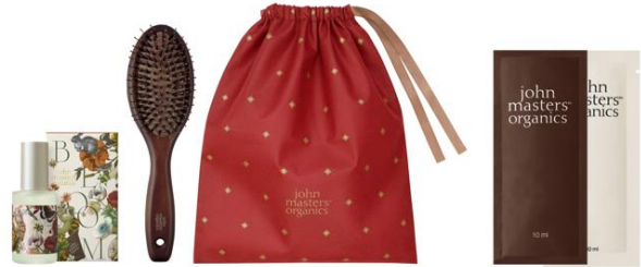
ジョンマスターオーガニック ご紹介商品のイメージ