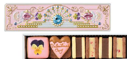
●パティスリー マグノリア 「宝塚いちごミルクショコラ」(8 個入) 3,601 円