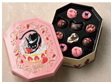
●ゴンチャロフ アンジュジュ 初登場 「アンジュジュ F」(10 個入) 1,296 円

7 階大催場の一角を「Happy Gift Market」と題し、ゴンチャロフ、モロゾフ、メリーチョコレートなど有名チョコレートメーカーのお手頃価格の可愛いデザインチョコレートそろえ集積展開します。ブランドの垣根なく自由に手に取って会計も 1 か所です。