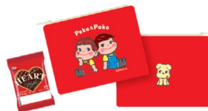
ペコポコチョコポーチギフト 1,210 円