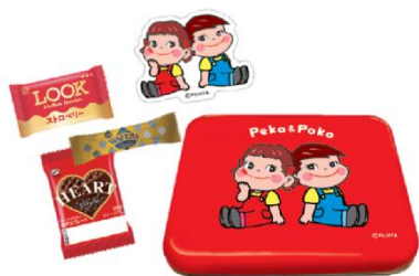
「ペコポコチョコ缶」 990 円

ニューレトロなペコポコデザインの缶に3種のチョコレートが入っています。ステッカー1枚入り。