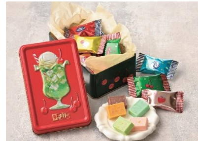
●メリーチョコレート はじけるキャンディーチョコレート。 「アソートメント缶(ミニ)」(9 個入) 1,080 円

スタイリッシュ&クールをテーマに、紅茶の新しい楽しみ方を提案。4 種類の茶葉と、それぞれに相性の良いチョコレートや素材を選び掛け合わせました。