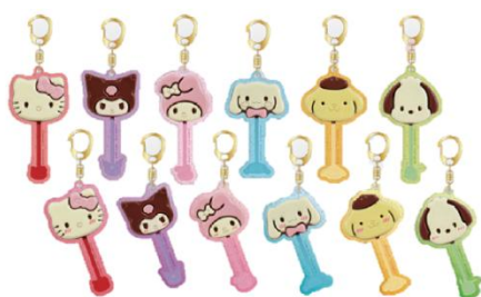
「サンリオキャラクターズ チョコレート トレーディングアクリルチャーム」各 858 円

不二家の「サンリオキャラクターズチョコレート」がアクリルチャームになって登場。全12種ランダムです。