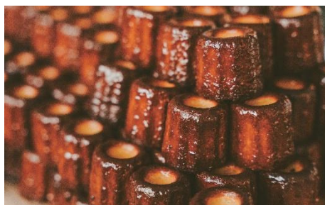
●クラマエカヌレ 初登場 「クラマエカヌレ」(1 個)324 円