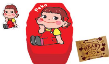
「ペコちゃんハートクッキーBOX」 691 円

ニューレトロなペコポコデザインの缶に3種のチョコレートが入っています。ステッカー1枚入り。