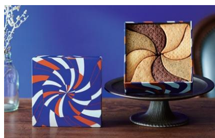
●架空のパティスリー しろいし洋菓子店 「しろいし洋菓子店のクッキー缶」 (34 個入 ※お酒使用)3,201 円

2025 年 7 月に開催した「Keio スイーツ博覧会」でも人気の高かったおしゃれなクッキー缶が再登場。