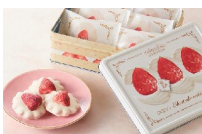
●コロパン 「コロパン ショートケーキクッキー」 (6 個入)2,160 円