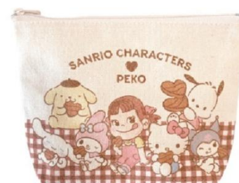
「マチ付きポーチ PEKO×サンリオキャラクターズ チェック」 (12cm×17cm) 1,100 円

不二家の「サンリオキャラクターズチョコレート」がアクリルチャームになって登場。全12種ランダムです。