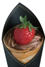
●パーラ 初登場 「苺とチョコレートのクレープ」 (1 個)1,700 円

口の中でパチパチはじける新感覚のチョコレート。懐かしさが漂うデザイン缶に 5 種のフレーバーが入っています。