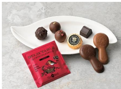
●TEA BAR by モロゾフ 「ティーバー」(14 個入 ※お酒使用) 1,188 円

あまおう苺味のトリュフとチョコレートに、スイートやホワイトのプレーンチョコレートなどを詰め合わせました。