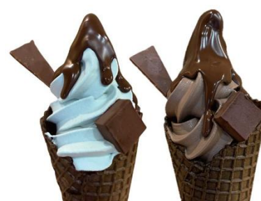
●ショコラトリ雨の詩 左:「チョコミントソフト」 右:「ショコラソフト」 (1 個)各 821 円

そのほかの実演スイーツショップ：●丸福バーム（バームクーヘン） ●ブノワ・ニアン（クッキー） ●ショコラティエ パレドオール（ソフトクリーム） ●銀座千疋屋（イチゴパフェ） ●メゾン クラシック ファクトリー（シュークリーム） ●BENE REGALO（ティラミス）