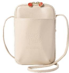
●「ショルダーバッグ」 3,200 円