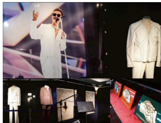
※写真は別会場の様子