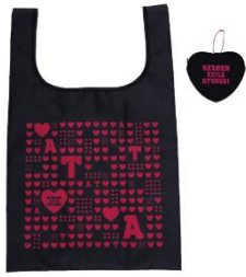
●「ポーチ付きエコバッグ」 2,800 円