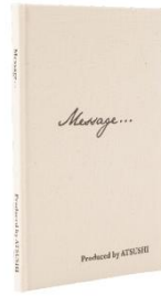
●「「Message」詩集(ヒーリング CD 付)」3,000 円 ※こちらの商品は、以前販売していた商品の再販売となります。 新作追加など内容変更はございません。