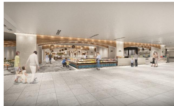
< B館2階リニューアルイメージ >

※現時点での設計に基づくものであり、今後の協議等により変更となる場合があります。