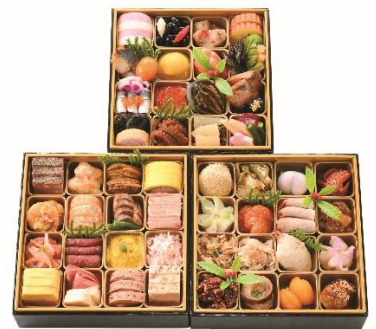
冷凍おせちで予約数量 第1位※ 京王百貨店オリジナルおせち「煌」 (3～4人前)16,200円 ※11月末現在

“予約はしなかったが、やっぱりおせちが食べたい”という駆け込みのニーズに対応し、例年大晦日に販売する「直前でも買えるおせち」。2～3人前のおせちを中心に、6千円台から2万円台の価格帯で約15種類そろえます。日本料理店の名店が手掛けるおせちや惣菜・デリカ売場の各ショップオリジナルおせちが登場します。