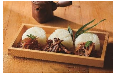
浅草今半 お好み小箱詰合せ (牛肉ごぼう 60g、牛肉れんこん 60g、 牛肉まいたけ 60g 各 1) 1,620 円