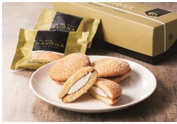
ホテルニューオータニ ニューオータニナボナ (5 個入) 1,080 円 【賞味期間 60 日】

カジュアルギフト需要に応える 1,000～2,000 円台の低価格帯のギフト 50 品目を揃えます。銘店やホテルの味を少量ずつ組み合わせて贈るのにもおすすめです。