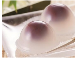
花園万頭 葛まんじゅう (8 個入) 1,728 円