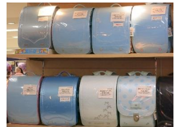
同系色の中でもパールやコンビカラー、ドット柄など、多彩なデザインが揃う

女兒はデザインを重視する方が多いため、カラーバリエーションやリボン・ハートなどをモチーフにしたものを種類豊富に取りそろえています。早期に購入する“こだわり派”には、凝った装飾のブランドランドセルやパールカラーなどが人気です。