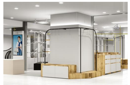
「ラシット」店舗イメージ

伝統の手仕事で作られる工芸品からデザイナーによる新しいプロダクトまで、幅広いアイテムがそろうライフスタイルショップ。洗練されたデザインながら手に取りやすい価格帯で展開します。