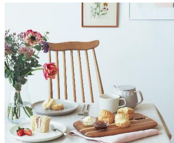
※画像はすべてイメージ