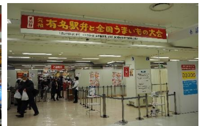
第56回大会(2021年)の会場の様子