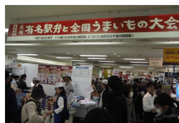
第55回大会(2020年)の会場の様子

全国各地の駅弁が集い、地域を象徴する食材や独自の調理法で作られた味の競演が繰り広げられる様は、いつからか「駅弁甲子園」と呼ばれるようになりました。1966年2月開催の第1回大会以降、今回で59回目を迎えるロングヒット催事です。