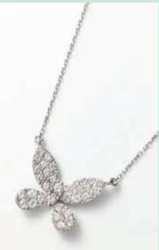
Ptダイヤモンドペンダント (D=計1.00ct, 45cmスライドチェーン) 275,000円(現品限り)