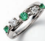
Ptエメラルドダイヤモンドリング (E=計0.22ct, D=計0.20ct) 176,000円(現品限り)