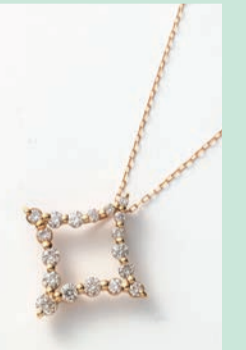
K18ダイヤモンドペンダント (D=計0.30ct, 40cm) 143,000円(現品限り)