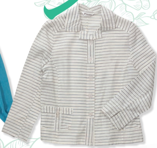
シルク混ジャケット 11,000円