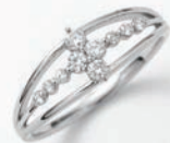
Ptダイヤモンドリング (D=計0.20ct) 121,000円(現品限り)