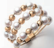
K18アコヤベビーパールフリーサイズリング (2.0mm珠) 99,000円(現品限り)