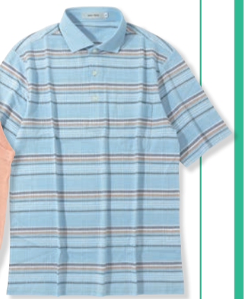
半袖ポロシャツ 7,700円