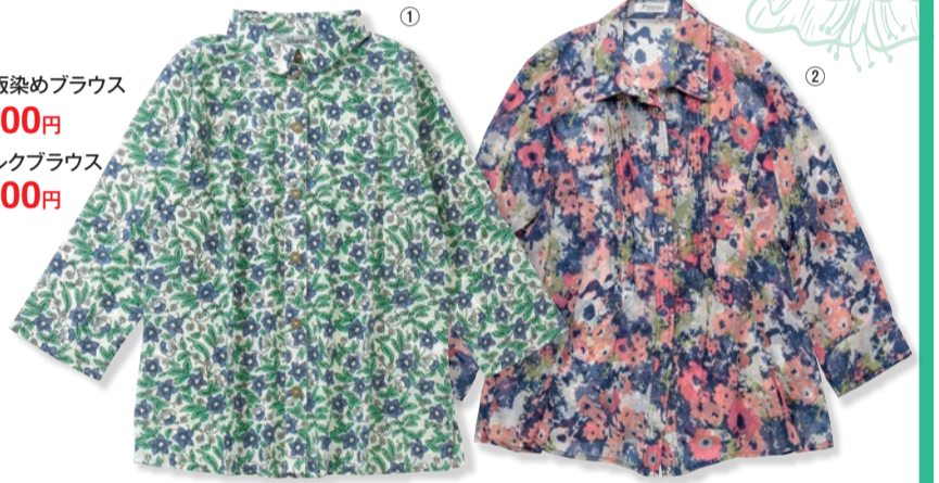
①木版染めブラウス 5,500円 ②シルクブラウス 7,700円