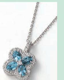
Ptアクアマリンダイヤモンドペンダント (AQ=計0.60ct, D=計0.19ct, 45cmスライドチェーン) 198,000円(現品限り)