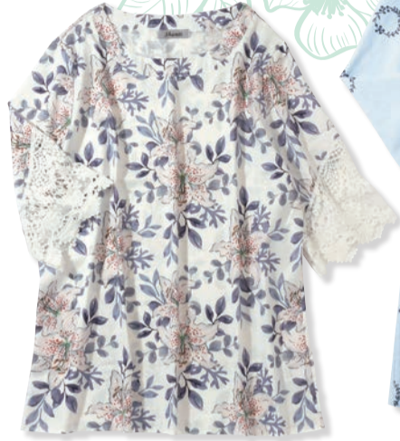
レース付ブラウス 3,300円