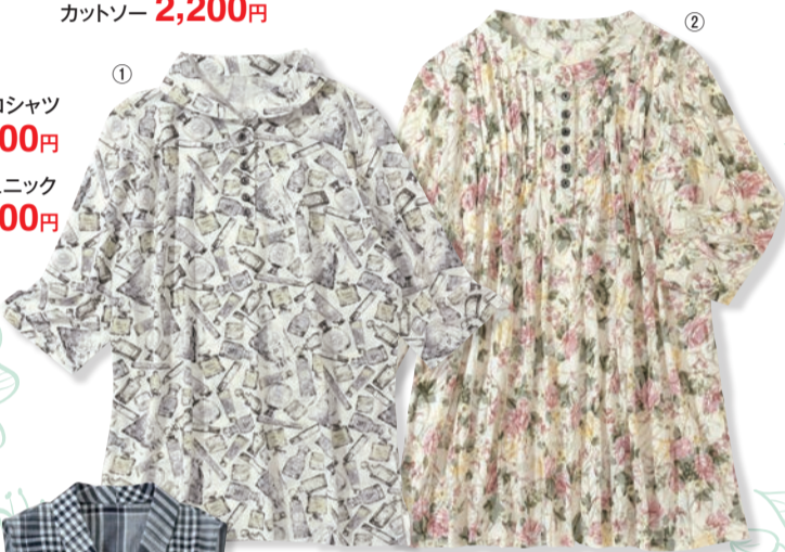
①ポロシャツ 7,700円 ②チュニック 3,300円