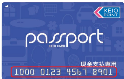
カード番号(1000から始まる16桁)