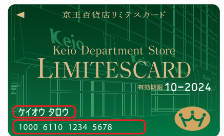
カード番号(100061から始まる16桁)およびカード名義

※京王パスポートカードをご利用の際、番号の記入がないと、ポイントや年間お買上実績の加算ができない場合がございます。後からの加算はできませんので、ご了承ください。