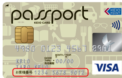
お客様番号(下段の12桁)